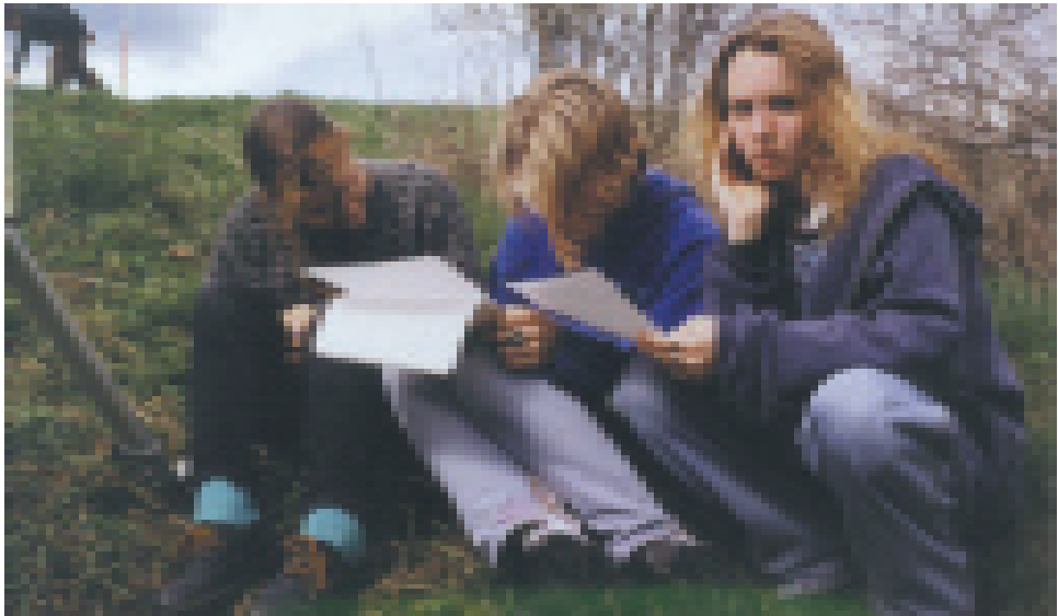
Feldmessen in Tschechien

puterexperten enthalten, der den anderen Teilnehmern bei der Erledigung der Untergruppenaufgabe eine Hilfe wäre.