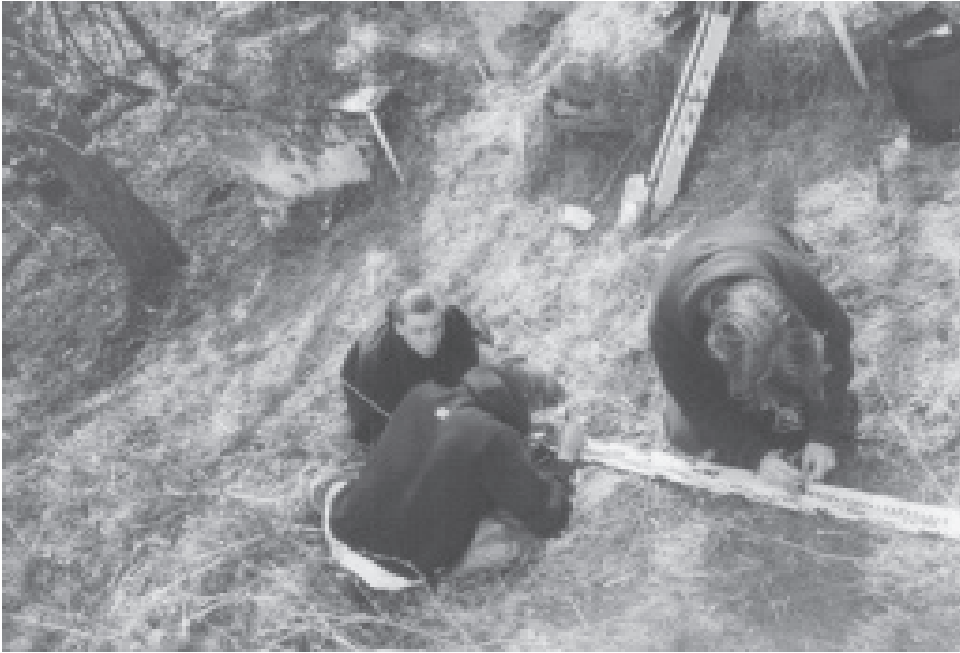
Feldmessen in Tschechien, 10. Klasse

geeigneter Raum eingerichtet werden. Da dies in Arbeitsgruppen geschah, erlernten die beteiligten Schüler nicht nur die Auseinandersetzung mit Hardware und Betriebssystem- und Anwendungs-Software, sondern eigneten sich auch organisatorisches und finanzielles Geschick an. Die Zusammenarbeit fand klassenstufenübergreifend statt, so dass Schüler aus der 9. mit Schülern aus der 12. Klasse zusammenarbeiteten.